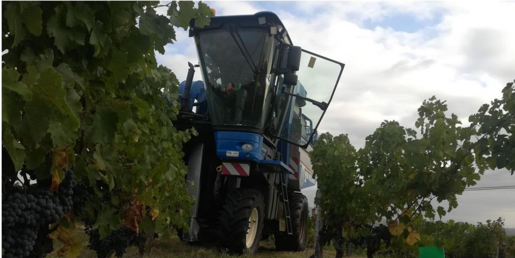
▲ Cette machine a été acquise à l'état de prototype, en 2015.

Chez les Vignerons de Buzet, la machine à vendanger Oenocontrol permet de tirer le meilleur du raisin.